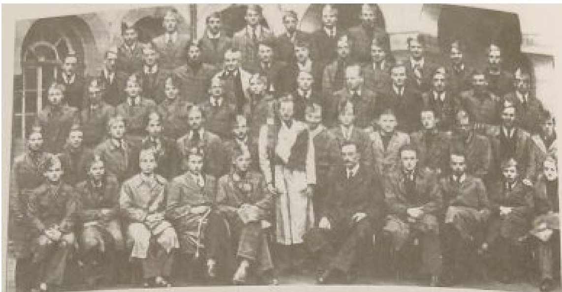
Elèves du lycée de Brest préparant l'entrée à l'école Saint-Cyr, 1939-1940.

C'est en classe, que les élèves ont pris connaissance du document de départ de cette étude : celle d'une photo de classe de l'année scolaire 1939-40 de l'ancien « Lycée de Brest », non mixte. Qui parmi ces jeunes hommes se sont engagés dans la résistance ? Quels engagements ont-ils eu ?