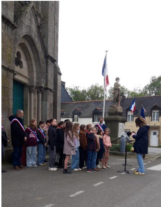
Interprétation de chants