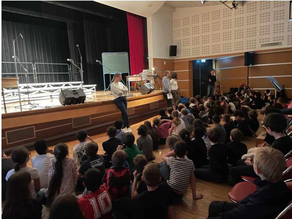
répétitions du spectacle.