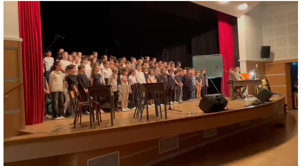
Spectacle du 1 er avril.