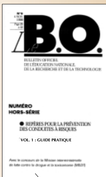
VOL. 1 : GUIDE PRATIQUE