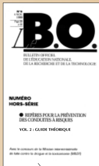
VOL. 2 : GUIDE THÉORIQUE